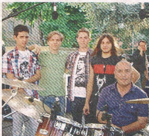
Nelle foto alcuni dei gruppi protagonisti del concerto di fine anno della Scuola di Musica Moderna tenuto domenica in piazza Castello. Qui sopra a destra, alcuni degli insegnanti della Scuola che è risultata una delle più frequentate della regione